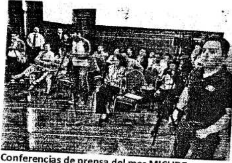
Conferencias de prensa del mes MICUDE